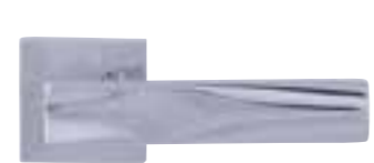
VD22, Chrom glänzend