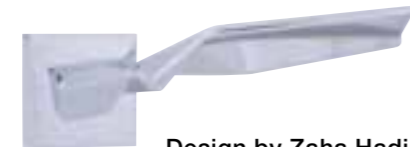
Design by Zaha Hadid VD21, Chrom glänzend