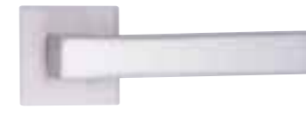
PD12, Chrom matt