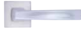
PD15, Chrom matt